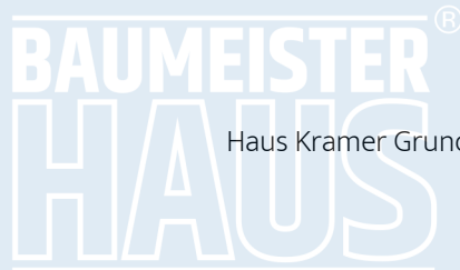
Haus Kramer Grundriss