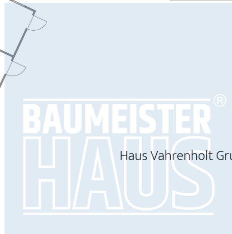
Haus Vahrenholt Grundriss