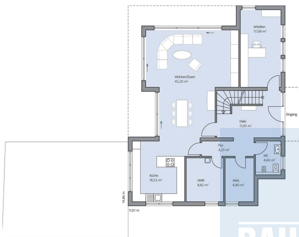
Haus Volkmann Grundriss