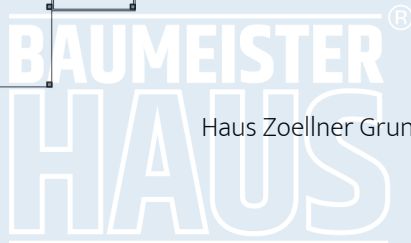
Haus Zoellner Grundriss